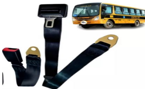
CISTO DE SEGURANÇA DE DUAS PONTAS COM REGULAGEM