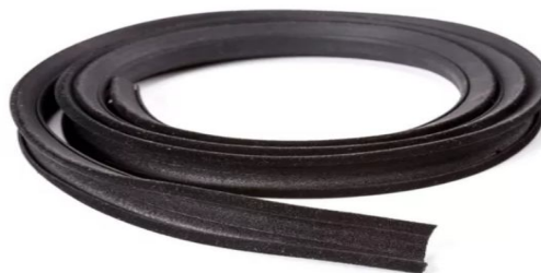
JOGO DE PAR DE CANALETAS