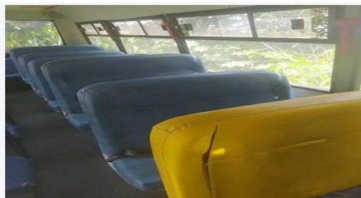
BANCOS TIPO POLTRONAS COM ASSENTO FIXO