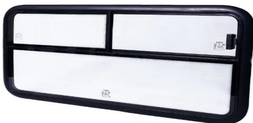
VIDRO JANELAS LATERAIS DE CORRER C/ 5mm DE ESPESSURA, 76cm comprimento e 57cm de altura