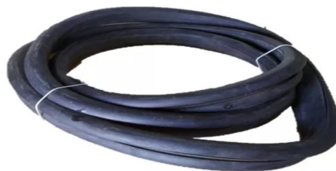
BORRACHA JANELA E PORTA